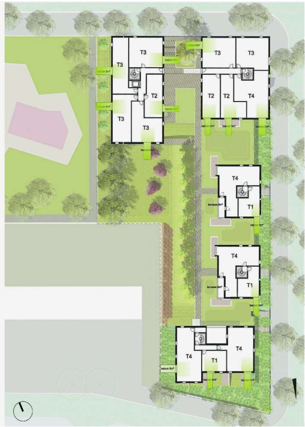
Plan étage courant