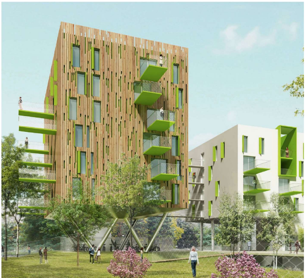
Vue depuis le cœur d'îlot