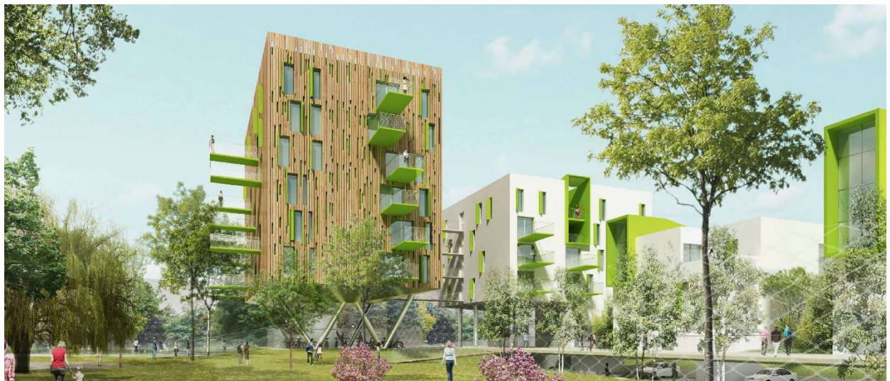
Vue depuis le cœur d'îlot